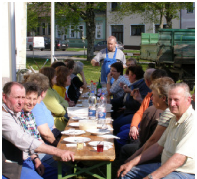
Nach getaner Arbeit gibt es eine Stärkung: In zwei Etappen (16. und 20. April) wurde Maria Moos von Ehrenamtlichen gereinigt.