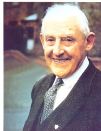
Frank Duff, 1889 -1980, Gründer der Legio Mariens

Um 18.30 beginnen wir mit dem Rosenkranz anschließend Maiandacht mit Legionsgebeten. Hefte (Tessera) liegen auf.