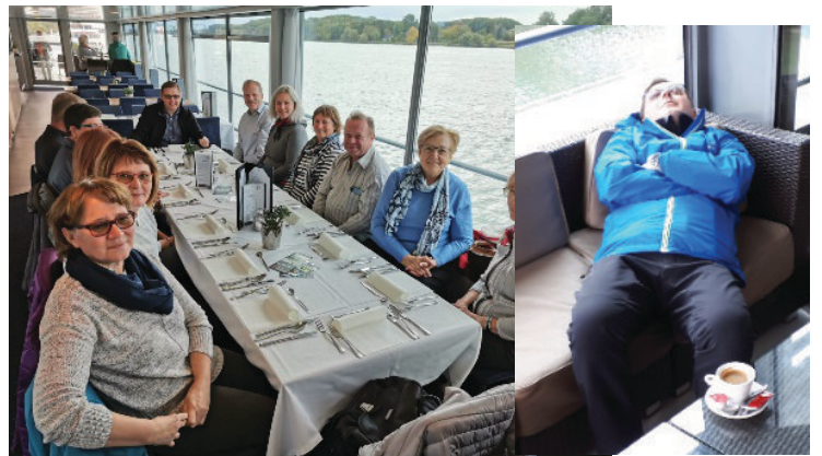
An Bord gab es ein Mittagessen und anschließend die wohlverdiente Ruhe.

Nach einem Zwischenstopp in Melk ging es wieder zurück nach Krems, wo unser Ausflug endete und wir mit dem Autobus wieder nach Zistersdorf zurück fahren.