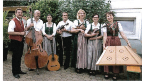
Volksmusikensemble aus Hollabrunn-Breitenwaida